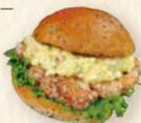
タルタル 山賊焼バーガー