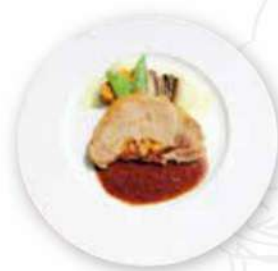
フジザクラポークのソテー ヴァイオレットマスタード