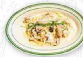
健味鶏と彩りきのこの ジャージークリームパスタ