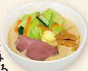
ジャージー MISO ラーメン