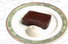
12/1～冬期限定デザート テリーヌショコラ