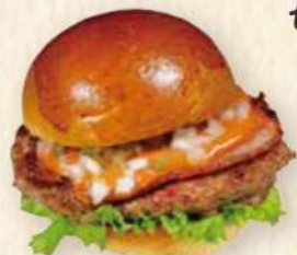
オリジナル ハンバーガー