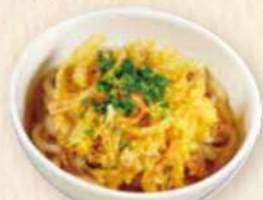
野菜ときのこの かき揚げうどん