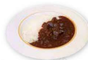
伝統の清泉寮カレー