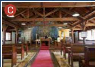
清泉開拓の歴史を刻む静謐な祈りの場へ お気軽にお立寄りください 清泉聖アンデレ教会