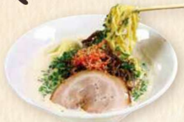
ジャージーミルク とんこつラーメン