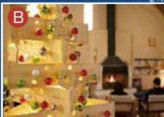
暖炉の炎とともに心温まる時間を 清泉寮新館ロビー