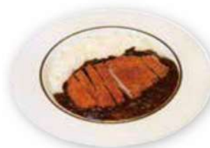
山梨県産ポークの カツカレー