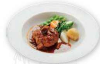
自家製煮込みハンバーグ 季節の野菜添え