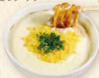
ジャージーミルククリームの カレーうどん