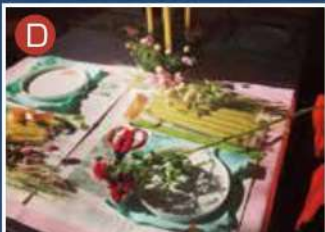
クリスマスクラフト各種(随時受付) ポールラッシュ記念館