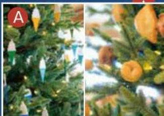
特製のソフトクリーム/本物のパンの飾り 清泉寮ジャージーハット