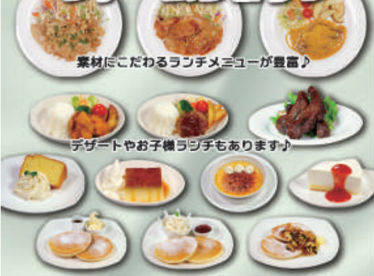
デザートやお子様ランチもあります♪