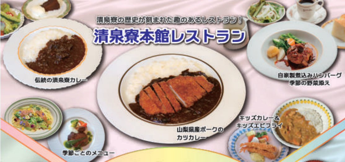
伝統の清泉寮カレー