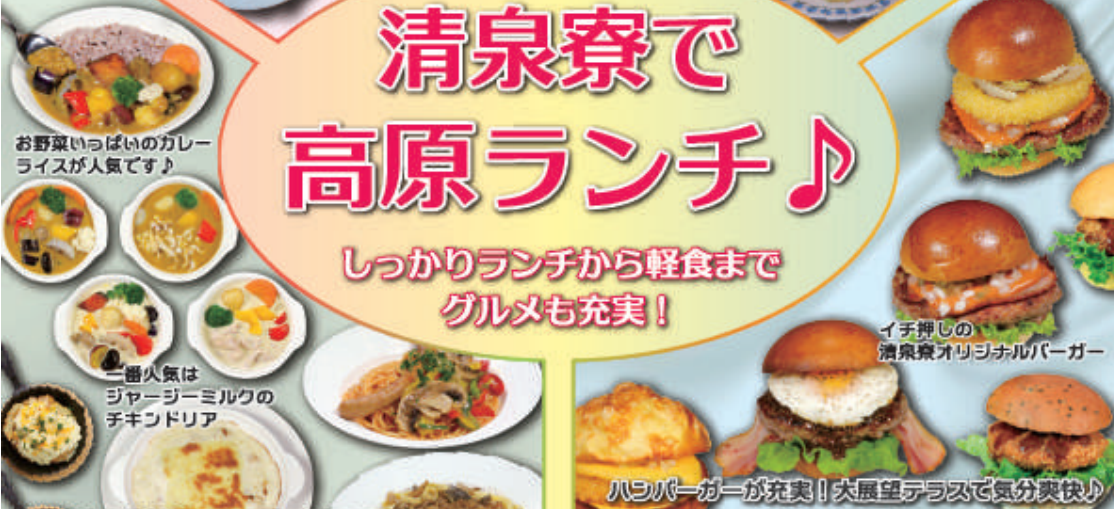
お野菜いっぱいのカレー ライスが人気です♪