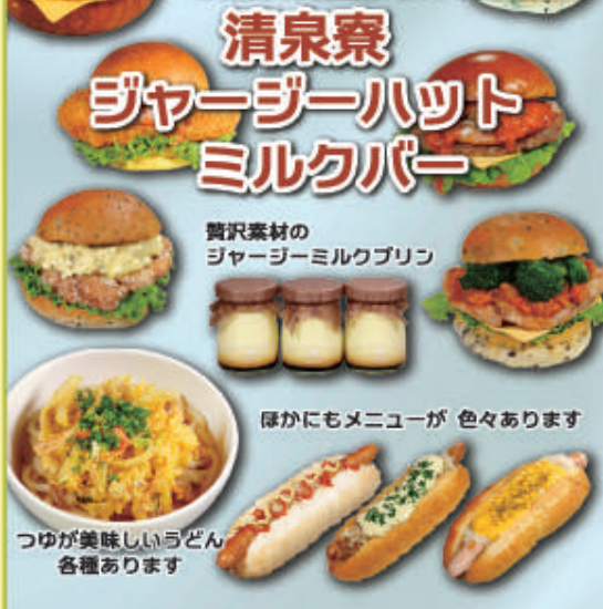
贅沢素材の ジャージーミルクプリン