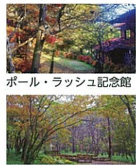
レノックス野外礼拝所