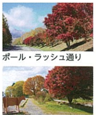
清泉寮ファームショップ